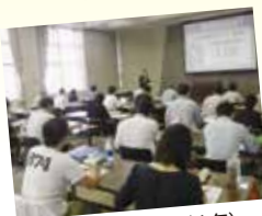
熱の入った講義(昨年)