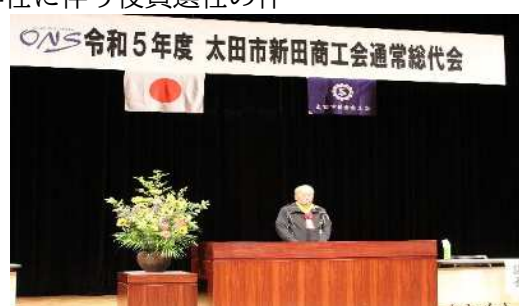
清水聖義太田市長