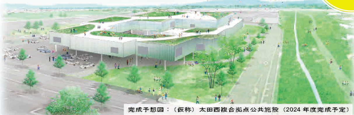
完成予想図：(仮称) 太田西複合拠点公共施設 (2024年度完成予定)