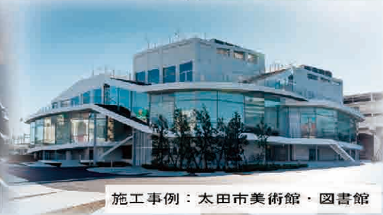
施工事例：太田市美術館・図書館

～建ててからが本当のお付き合い～を合言葉に地域に根ざした企業として『顧客満足』『社員満足』『協力業者満足』『地域満足』を追求し、『石川建設で良かった!』を目指してまいります。