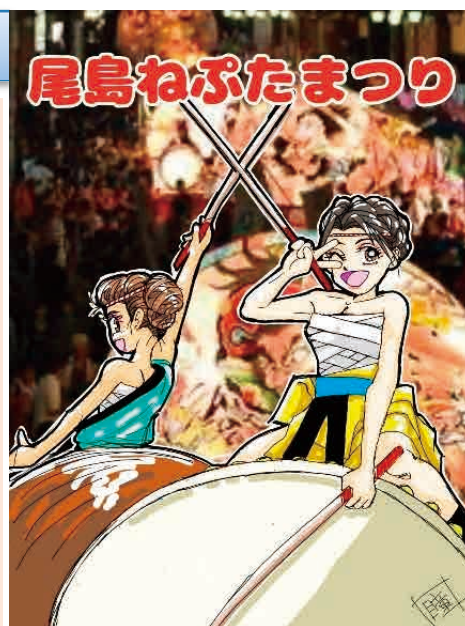
絵：(有)佐瀬工業 佐瀬信之さま