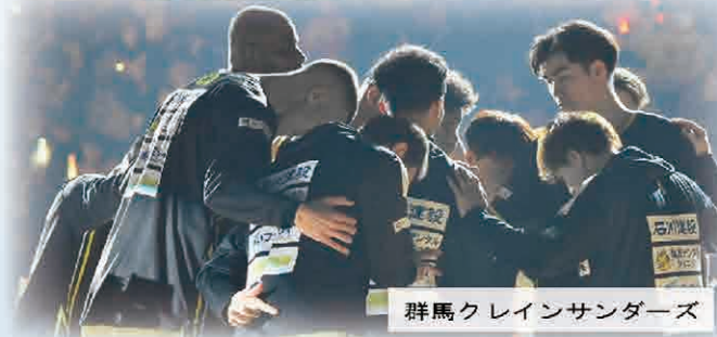
群馬クレインサンダーズ