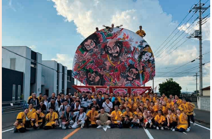
(商工会青年部員のみなさん)

8月14日(水)、15日(木)の2日間、尾島ねぶたまつりが開催されました。場所は尾島商店街大通りその周辺(今年度は亀岡神社東から三菱電機(株)群馬工場南交差点まで)と区間が延長されました。元気な「ヤーヤドー!」の掛け声とともに9台ものねぶたが会場を練り歩き、太田の夏の夜に浮かび上がる勇壮な武者絵や美人絵がとても幻想的で心を揺さぶられました。まつりのクライマックスであるねぶた太鼓とまつり囃子の大合奏は圧巻で、来年の開催も今から楽しみです。