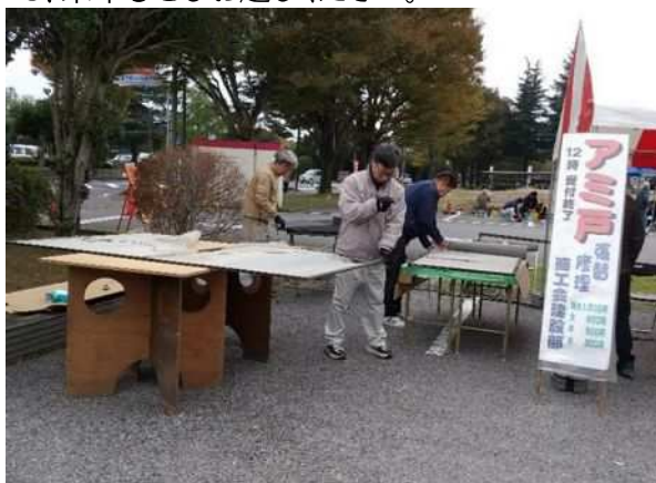
(熟練の職人による網戸の張替え)

地域の皆様からは、「仕上がりや価格に喜びの声」をいただきました。今後も続けていきますので、来年もぜひお越しください。