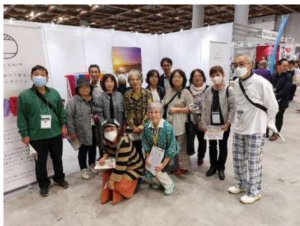
(商工会出展ブースでの集合写真)

参加者からは、“規模の大きい展示商談会で圧倒される”、“初めて見る展示会で自社の出展を検討する”などの声があり、県外への販路拡大の機運が高まった視察となりました。